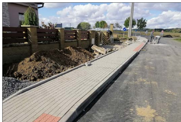
TEXT a FOTO: Ivo Klimeš

V srpnu byly zahájeny práce na chodníku a dešťové kanalizaci v ulici Za Branou s termínem dokončení konec října. Termín dokončení chodníku jsme byli nuceni posunout na 19. 11. 2021, kdy proběhlo předání stavby. Zhotovitelem byla firma Colas a.s. Celkové náklady na chodník včetně dešťové kanalizace byly 3 242 142,28 Kč.