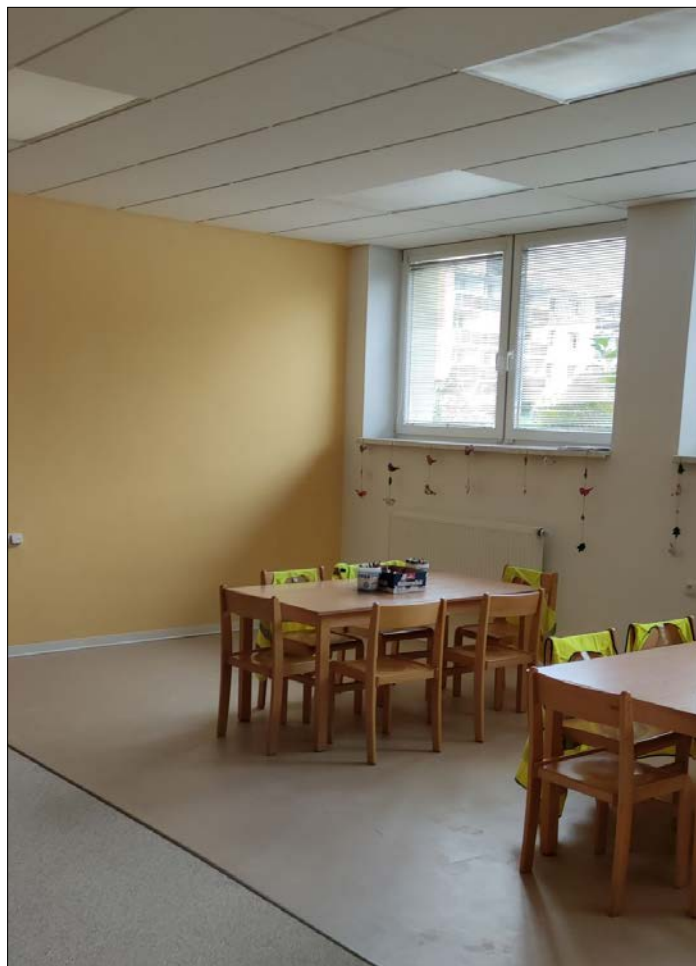
TEXT a FOTO: Miroslav Juračka

Současně s rekonstrukcí tříd MŠ proběhla i rekonstrukce jednoho oddělení školní družiny. Jednalo se o třídu v suterénu školy, vedle učebny výpočetní techniky. Na tuto akci jsme bohužel nedostali dotaci z Ministerstva financí a celou akci jsme realizovali z rozpočtu městyse. Ve třídě byla rekonstruována podlaha, akustický strop včetně nového osvětlení, nová otopná tělesa a byla vyměněna elektroinstalace. Byly zde instalovány nové dveřní obložky, včetně dveří. Vedení topení bylo nově skryto pod novým podhledem. Do třídy byl zakoupen i nový nábytek.