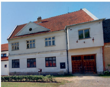
Původní stav budovy před demolicí