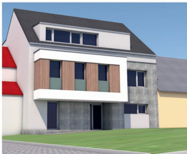
Projekt zázemí managementu - vizualizace