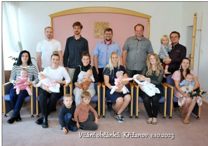
Vítání občánků Křižanov 1.10.2023

Přivítáno bylo celkem 9 dětí, šest občánků z Křižanova a po jednom z Kozlova, Jívoví a Svinů.