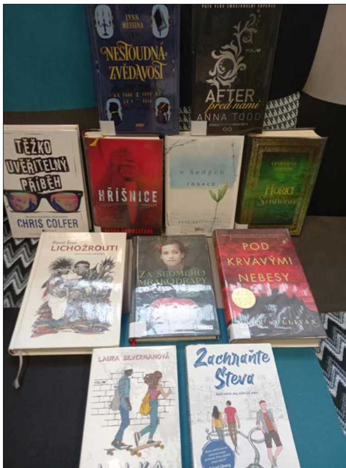
TEXT a FOTO: Markéta Engelhartová