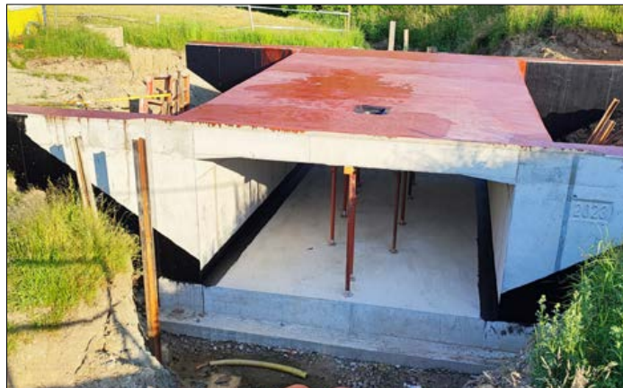
TEXT a FOTO: Ivo Klimeš za městys Křižanov

Práce na mostu v ulici U Školy jdou dle harmonogramu. V současné době je již hotová mostní konstrukce včetně izolačního náteru. Následovat budou zemní práce, obsypání mostní konstrukce a příprava podkladních vrstev pro komunikaci a chodníky. Termín dokončení včetně pokládky asfaltových vrstev je plánován na srpen 2023 .