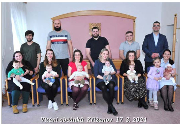
Vítání občánků Křižanov 17. 3. 2024