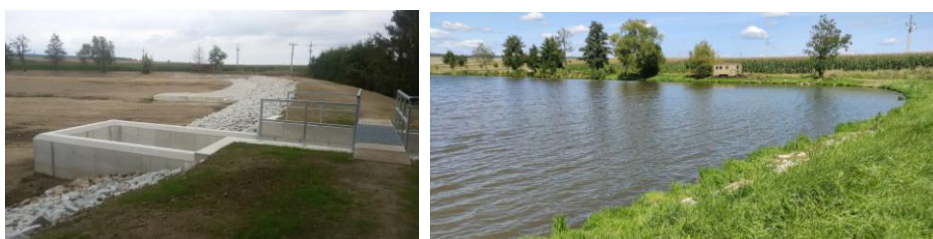
STAV PO REALIZACI: