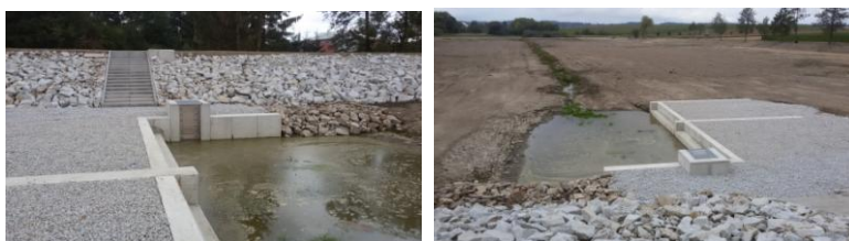
STAV V PRŮBĚHU REALIZACE: